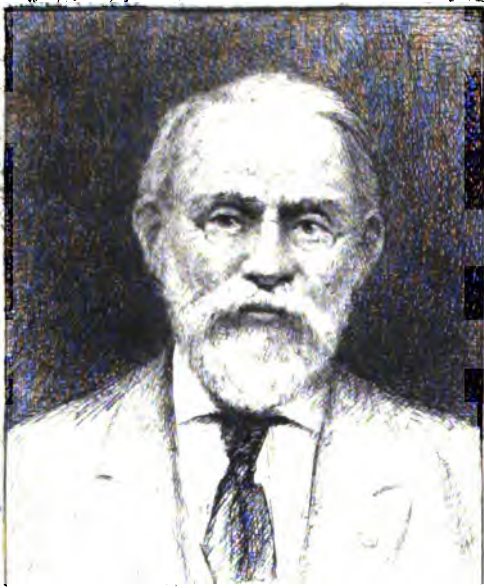
SILAS WRIGHT DUNNING BEQUEST UNIVERSITY OF MICHIGAN GENERAL LIBRARY